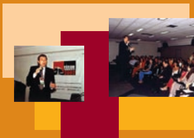
Dr. Antonio Carlos Aguiar proferindo palestra na cidade de Uberlândia sobre Diminuição de Custos e Prevenção de Ações Trabalhistas.

trabalhistas e prevenção de ações trabalhistas — despertou bastante interesse junto aos empresários, sendo motivo, inclusive, de recente matéria publicada no jornal Gazeta Mercantil no dia 20 de junho. PC